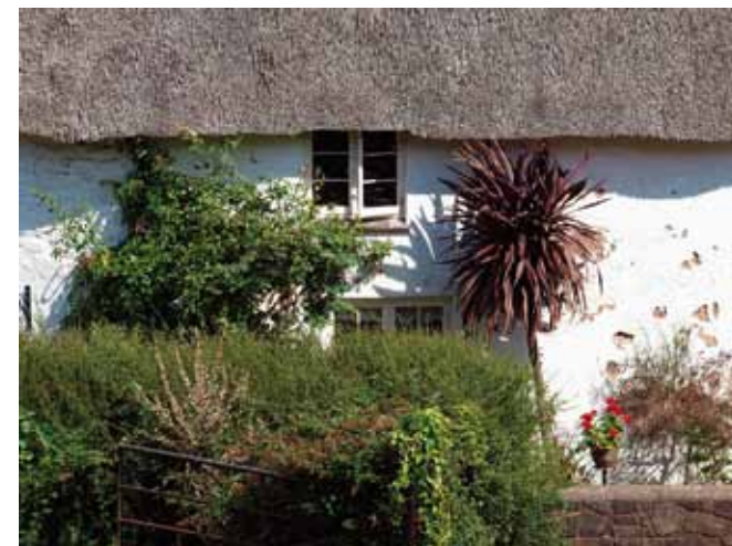
Bauernhaus in Cornwall, England