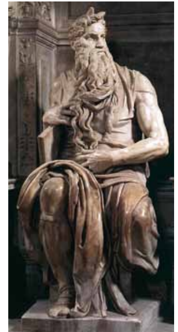
Michelangelo, Moses Rom, San Pietro in Vincoli

Fortgesetzt wird die Reihe im Sommersemester ab 23. März 2011: Fünftes bis Zehntes Gebot – 7 Abende