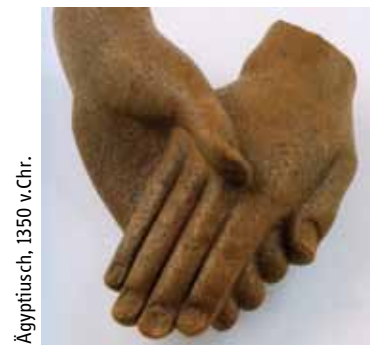
Ägyptisch, 1350 v.Chr.