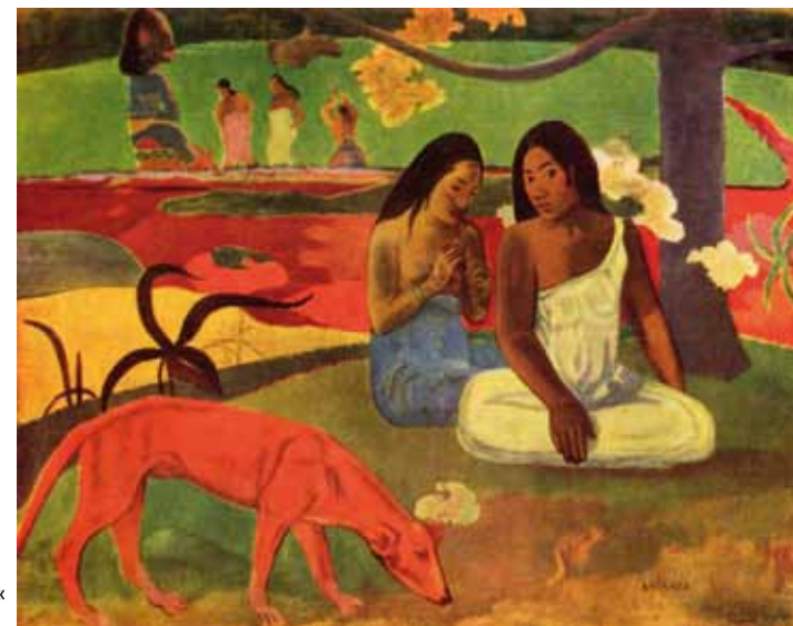
Paul Gauguin, Arearea »Freude« (1892, Musée d'Orsay, Paris)